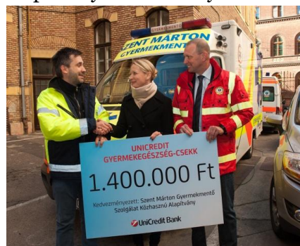
Adományátadás 2015 - Szent Márton Gyermekmentő Alapítvány

Hiszünk abban, hogy a nagyszabású programok mellett a kisebb kezdeményezéseknek is helye van. Ezért az aktualitások mentén támogatjuk a gyermekek egészségére fókuszáló alapítványi kezdeményezéseket. Ennek részét képezi, hogy a partnereknek szóló karácsonyi ajándék helyett – munkatársaink szavazatai alapján – anyagi támogatást nyújtunk a kiválasztott szervezeteknek.